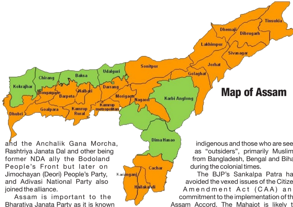
Map of Assam

The results of the election will be announced on May 2, along with the results of the other 4 states Kerala, Tamil Nadu, West Bengal & Puducherry. 13 major and minor political parties are at play including two coalitions led by the ruling Bharatiya Janata Party and the Congress. The 2016 assembly elections saw the BJP form its first government in the state with its allies, with a remarkable victory and the party is now looking to secure a second term. The Congress under the banner of "Mahajot" had initially six parties when it was formally announced on 19th January, including the Congress, All India United Democratic Front (AIUDF), the Communist Party of India, CPI (Marxist), the CPI (Marxist-Leninist)